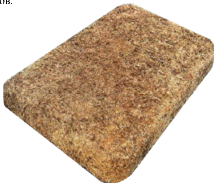
Рис.3. Элемент фильтрующий торфяной ЭФТ

3. На основе выполненных исследований доказана целесообразность и эффективность применения торфяных фильтрующих материалов при очистке поверхностных сточных вод. В период 2000–2014 гг. налажено производство торфяного фильтрующего материала. Торфяной фильтрующий материал – «Элемент фильтрующий торфяной» (ЭФТ) представляет собой пористые волокнистые плиты, изготавливаемые в соответствии с ТУ 0391-018-02997983-98 без применения иных компонентов.