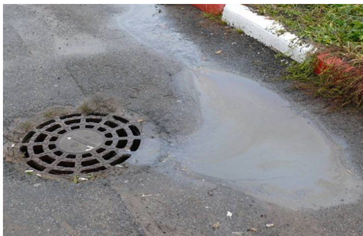
Рис. 1. Типичный поверхностный сток

Выдвигаемая работа отличается научной и практической новизной и является результатом законченных научно-исследовательских и опытно-конструкторских работ, выполненных в период 1994 – 2015г.г.