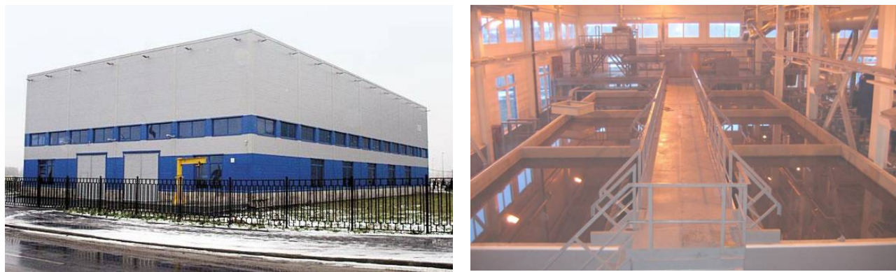
Рис.5. ОСПС нежилрой зоны «Пулкovo-3» (ГУП «Водоканал Санкт-Петербурга»)

поощрения их к осуществлению рациональных программ управления поверхностным стоком.