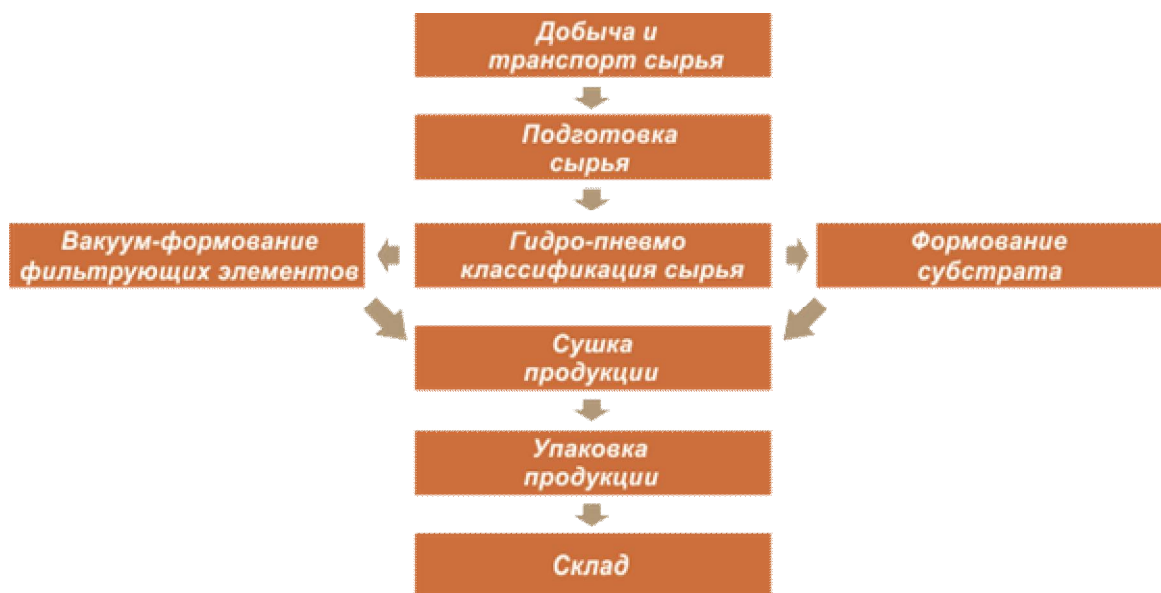
Рис. 2. Структурная схема технологической линии безотходной комплексной переработки торфяного сырья

2. Разработана технология и оборудование для безотходной комплексной переработки торфяного сырья, позволяющие в едином технологическом цикле производить торфяной фильтрующий материал и высокоаэрированный субстрат для выращивания растений, что существенно повышает экономическую эффективность технологии.